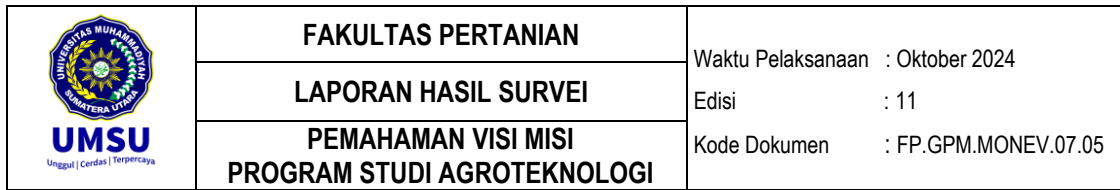
Tabel 2 PEMAHAMAN VISI MISI PROGRAM STUDI AGROTEKNOLOGI FP UMSU